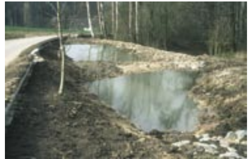
Abb. 3. Die zahlreichen Straßensperrungen und Schutzeinrichtungen an Straßen haben die Erdkröte stark gefördert