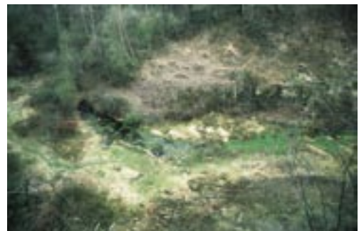
Abb. 4. Radikale Entbuschungsmaßnahmen im Naturschutzgebiet Steinbruch Schüren sollen Kreuzkröte und Waldeidechse fördern