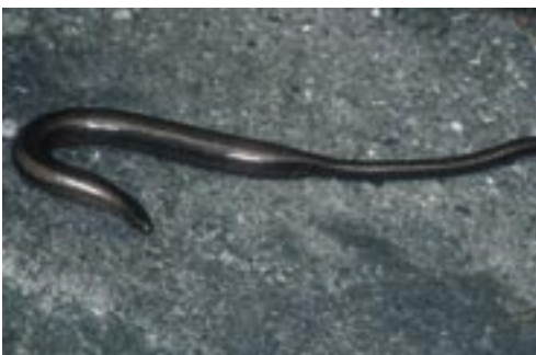
Abb. 2. Auch die Blindschleiche ist an den Waldrändern noch gut verbreitet, wie dieses trüchtige Weibchen beweist