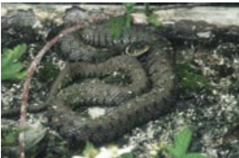
Abb. 6. Durch Nachzuchten soll in Dortmund durch GERHARD HALLMANN und GEORG OLBRECH eine zweite Ringelnatterpopulation aufgebaut werden