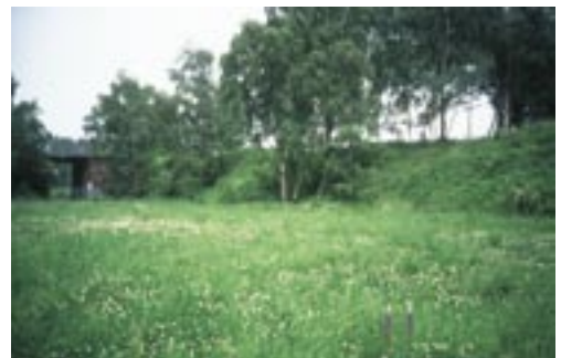
Abb. 9. Durch nach Bergrecht genehmigte Verfüllung wurde ein etwa 300 Teichfrösche beherbergendes Laichgewässer zugeschüttet. Als Ersatzmaßnahme wurde dort dann wieder ein neues Gewässer angelegt, das heute Kreuzkröte und Teichfrosch als Laichhabitate dient. Durch diesen herpetologischen Schildbürgerstreich hat sich die Situation für die Kreuzkröte allerdings sogar noch verbessert, während die Teichfrösche teilweise im Dortmunder Emskanal abgeläicht haben.