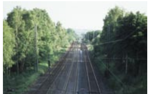
Abb. 8. Bahnlinien verbinden die 14 in Dortmund verstreut liegenden Kreuzkrötenhabitate