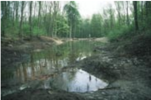
Abb. 1. Die zahlreichen Teiche in den Dortmunder Laubmischwäldern beherbergen mit bis zu 300 abgelegten Laichballen große Grasfroschpopulationen

Gerade die nur noch als gefährdet eingestufte Kreuzkröte hängt allerdings mehr denn je am Tropf naturschützerischen Engagements. Sie ist durch zahlreiche Artenschutzmaßnahmen wesentlich gefördert worden, doch ihre aktuell genutzten Vorkommen liegen allesamt auf naturschutzrechtlich ungesicherten Bereichen, welche durch die Reaktivierung für Gewerbeansiedlungen gefährdet sind. Stand das Prädikat der „krötenfreundlichsten Großstadt“ noch bis Ende des 20. Jahrhunderts in Dortmund für den Schutz und den Erhalt der Erdkröte, so ist die Krötenart des beginnenden 21. Jahrhunderts eindeutig die Kreuzkröte, deren Bestand in den letzten 10 Jahren nicht nur konstant geblieben ist, sondern dank eines flächendeckenden