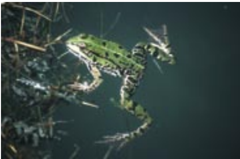
Abb. 5. Der Teichfrosch ist fast in jedem sonnenexponiertem Gartenteich oder Regenrückhaltebecken zu Hause

für Dortmund einmaligen Sandbodenstandorte im Nordwesten mit ökologisch fragwürdigen Schwarzkiefern völlig zerstört und das, obgleich diese Kieferschonung direkt am „NSG Mender Heide“ angrenzt. Auf der dort vorhandenen letzten Sandbodenfläche ist unverständlicherweise eine Wohnbebauung geplant. Die insekten- und krautartenreichen Freiflächen wurden im Zuge von „Ausgleichs- und Ersatzmaßnahmen“ – welch ein Widerspruch – biozönotisch irreparabel durch Bäumchenpflanzen geschädigt. Kundige Betrachter gewinnen dabei den Eindruck, dass nur „sichtbar viele“ dichte Aufforstungsflächen als Beweis für „ökologisches Handeln“ gelten. Leider soll diese Form einer ökologisch unverträglichen Begrünung auch auf den von der Kreuzkröte als Lebensraum genutzten Halden und Deponien angewandt werden.