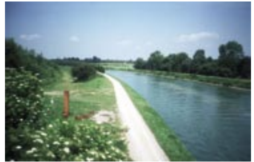
Abb. 7. Beidseits des Dortmund-Ems-Kanals befinden sich die größten Kreuzkröten- und Teichfroschpopulationen. Aufgrund der Verspundung ist der Kanal allerdings eine Totalbarriere für Amphibien